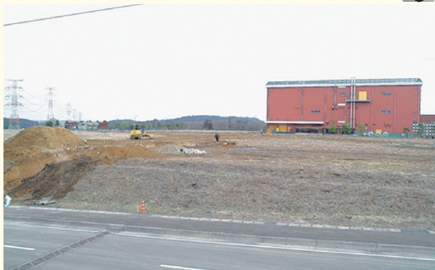
◆第2-3街区 西からの写真◆