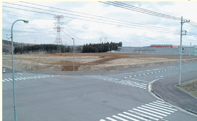
◆第4-2街区 北からの写真◆